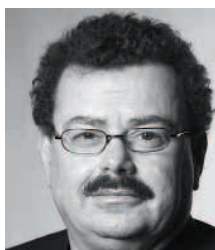
Energiordfører (EL) Per Clausen