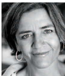
Energiordfører (RV) Margrethe Vestager