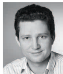
Energiordfører (S) Ole Hækkerup