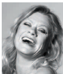
Skuespiller og sanger Pernille Højmark