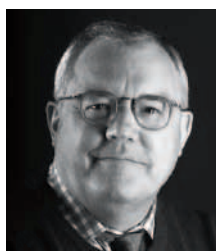
Politisk kommentator, fhv. minister og redaktionschef Hans Engell