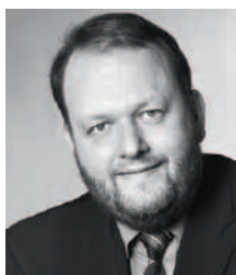
Energiordfører (V) Lars Chr. Lilleholt